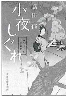
『小夜しぐれ みをつくし料理帖』 高田郁／著 角川春樹事務所 620円