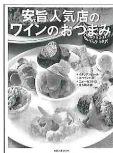
『安くて旨い人気店の ワインのおつまみ』 旭屋出版 1890円

いま、イタリアンバルやピストロ、スペインバルなど「安くて」「旨い」ワインと料理を魅力にする人気店が増えている。本書では、そんな繁盛店14店を紹介。おつまみの魅力、ワインへの考えを通して人気の秘密を探っている。