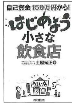
『はじめよう 小さな飲食店』 土屋光正／著 同文館出版 1470円

出題形式で様々な立地の特性について説明したり、また店舗のファサード、内装、照明などにいたるまで説明。店づくりが具体的に分かり、イメージもしやすくなっている。特に著者が建築士ということもあって、店の看板など細かいところまで解説されており、リニューアルの際にも参考になる一冊だろう。